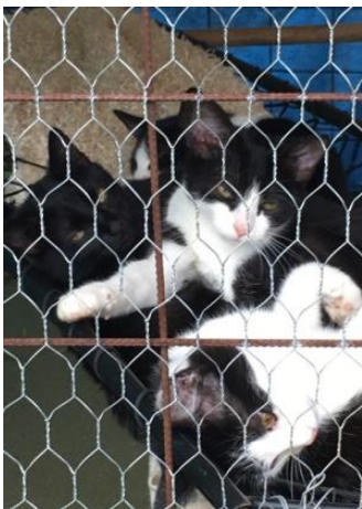
Unsere Jungkatzen im Tierheim

Nach einer vorzüglichen Verpflegung im Bildungshaus von Agro Caritas besuchten wir das im Bau befindliche neue Tierheim der Familie Szabo . Das Tierheim ist für maximal 50 Hunde konzipiert. Anfänglich skeptische Blicke wechselten in Zuversicht, dass dieses Kleintierheim für Hunde und Betreiber zu einem positiven Erlebnis werden wird. Die Eigenständigkeit ist ein wichtiges Grundelement für die gute Tierschutzarbeit. Starromania wird auch hier die medizinischen Grundkosten, die Jahresmiete und die Kosten der Fütterung übernehmen. Der ganze Umbau und die Verwirklichung dieses neuen Tierheimes wird Starromania ebenfalls finanzieren.