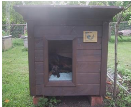
Hundehütte Typ „L1 Zürich“ für Hund Pascha

STARROMANIA ist bereit, mit ETHIA zusammen für eine gerechtere, l(i)ebenswerte, begeisterte tierschutzgerechte Politik in der Gesellschaft zu kämpfen.