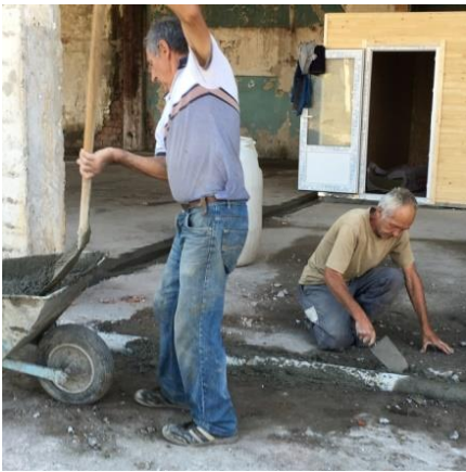
Arbeiten im neuen Tierheim Szabo

Nach einer vorzüglichen Verpflegung im Bildungshaus von Agro Caritas besuchten wir das im Bau befindliche neue Tierheim der Familie Szabo . Das Tierheim ist für maximal 50 Hunde konzipiert. Anfänglich skeptische Blicke wechselten in Zuversicht, dass dieses Kleintierheim für Hunde und Betreiber zu einem positiven Erlebnis werden wird. Die Eigenständigkeit ist ein wichtiges Grundelement für die gute Tierschutzarbeit. Starromania wird auch hier die medizinischen Grundkosten, die Jahresmiete und die Kosten der Fütterung übernehmen. Der ganze Umbau und die Verwirklichung dieses neuen Tierheimes wird Starromania ebenfalls finanzieren.