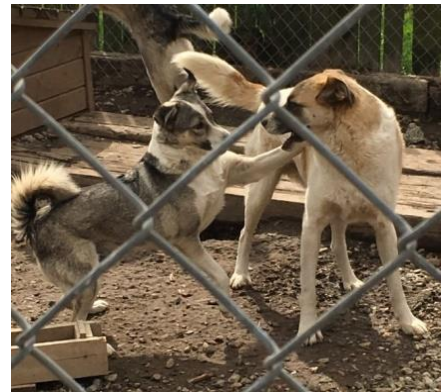
Spielende Hunde im Tierheim von Gheorgheni

Unserem Ziel zur Schaffung eines überregionalen Tierheims sind wir mit grossen Schritten näher gekommen. Wir haben verschiedene sich anbietende Liegenschaften inspiert und sind fündig geworden.