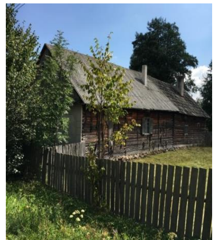
Wohnhaus im überregionalen Tierheim