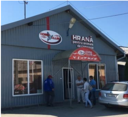
Der neue Tierfutterlieferant in Gheorgheni.

Der Besitzer der Firma HRANA pentru animale de Companie wird das Futter für unsere Hunde und Katzen bereitstellen. Für die Herstellung von Tierfutter hat er riesige Maschinen installiert. Er wird in der Lage sein, in ganz Rumänien seine hochwertigen Produkte abzusetzen.