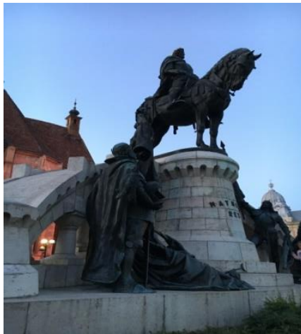
Ritterstatue von Mathias Rex in Cluj-Napoca