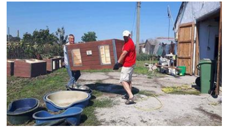
Vorbereitungsarbeiten für die Hunde

unermüdlich, unübertrefflich, beispielhaft, einfach „Active Friends“!