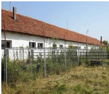
Das neue Tierheim in Tamaseu - Active Friends und STARROMANIA

Jede Reise nach Rumänien muss intensiv vorbereitet werden. Schon vor der Abreise wird mit unseren Leuten vor Ort genau besprochen, mit wem, wo und wann Termine festgelegt und welche Themen eingehend diskutiert werden müssen.